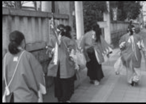
日野宿応援隊ひの散策組清掃活動の様子(八坂神社前)

新選組のふるさと日野を盛り上げるべく結成された有志によるボランティア団体。だんだららをまとい、不定期で日野宿本陣から日野駅周辺一帯の清掃活動や観光で訪れた方への道案内を行っている。毎年ひの新選組まつり一日目に日野宿本陣で行われる『本陣夜咄』は「日野宿応援隊ひの散策組」が主催。日野そして新選組を盛り上げるべく奮闘されている。